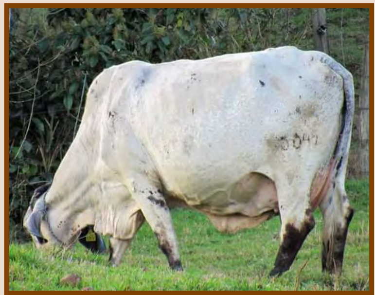
MÃE: ATHINA DM

TEATRO DA SILVANIA PTA: 344 KG/EMBRAPA/ABCGIL. GARBA DOS POCOES